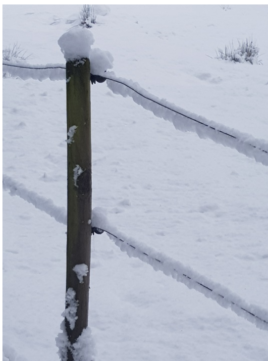
Än är det vinter kvar i delar av landet!