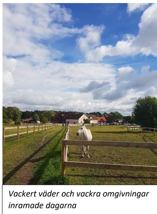
Vackert väder och vackra omgivningar inramade dagarna

Carolina Lagerlund och Elin LeeApple , Hästnäringens Nationella Stiftelse (HNS) presenterade resultaten av utvecklingsprocessen "Samordning och utveckling av hästunderstödda insatser i svenska samhället". Under ett års tid under sammanlagt fyra möten, utövare av HUI/HUT och intresserade i området diskuterad evaluerat möjligheter och framtidsutsikter av HUI.