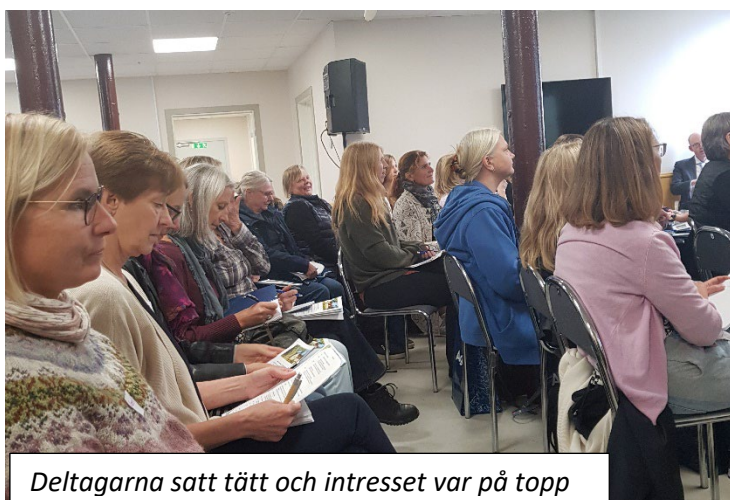
Deltagarna satt tätt och intresset var på topp